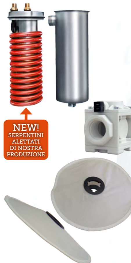
NEW! SERPENTINI ALETTATI DI NOSTRA PRODUZIONE