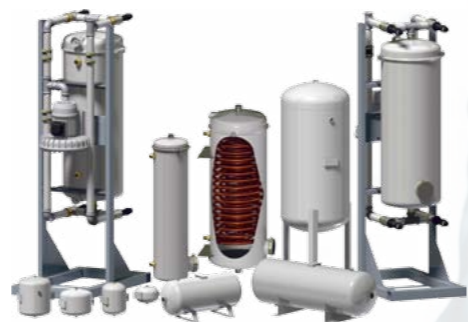
SERBATOI PNEUMATICI CE

La FAR è stata fondata il 18 febbraio del 1980.